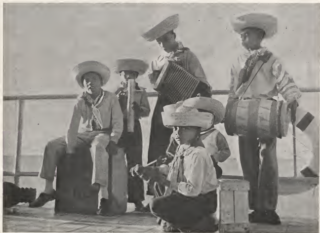
Romantical melodies of the Caribbean, in a performance by Aruban youngsters.